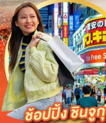
ช้อปปิ้ง ซินจุกุ

นั่งกระเช้าชมวิว ใบไม้เปลี่ยนสี Mt.Adatara