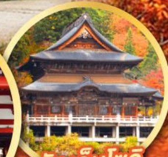
วัดเอ็นโซจิ

กิจกรรมเก็บผลไม้ พักออนเซ็น 2 คืน พักโรงแรมในโตเกียว 2 คืน